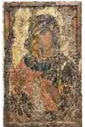
Θεοτόκος Γλυκοφιλούσα, 12ος και 16ος αιώνας.