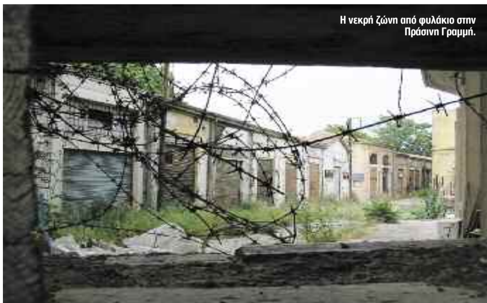
Η νεκρή ζώνη από φυλάκιο στην Πράσινη Γραμμή.

Στην Κύπρο, παρά τα πολλά πολιτικά λάθη, η ατμόσφαιρα είναι αντιστασιακή και η μεγαλύτερη προσφορά αυτών των ηρώων είναι ότι επηρεάζουν προς τη θετική κατεύθυνση και τους όποιους ενδοτικούς. Είμαι αισιόδοξος!