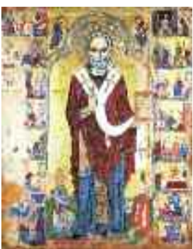
Άγιος Νικόλαος της Στέγης, 13ος αιώνας.