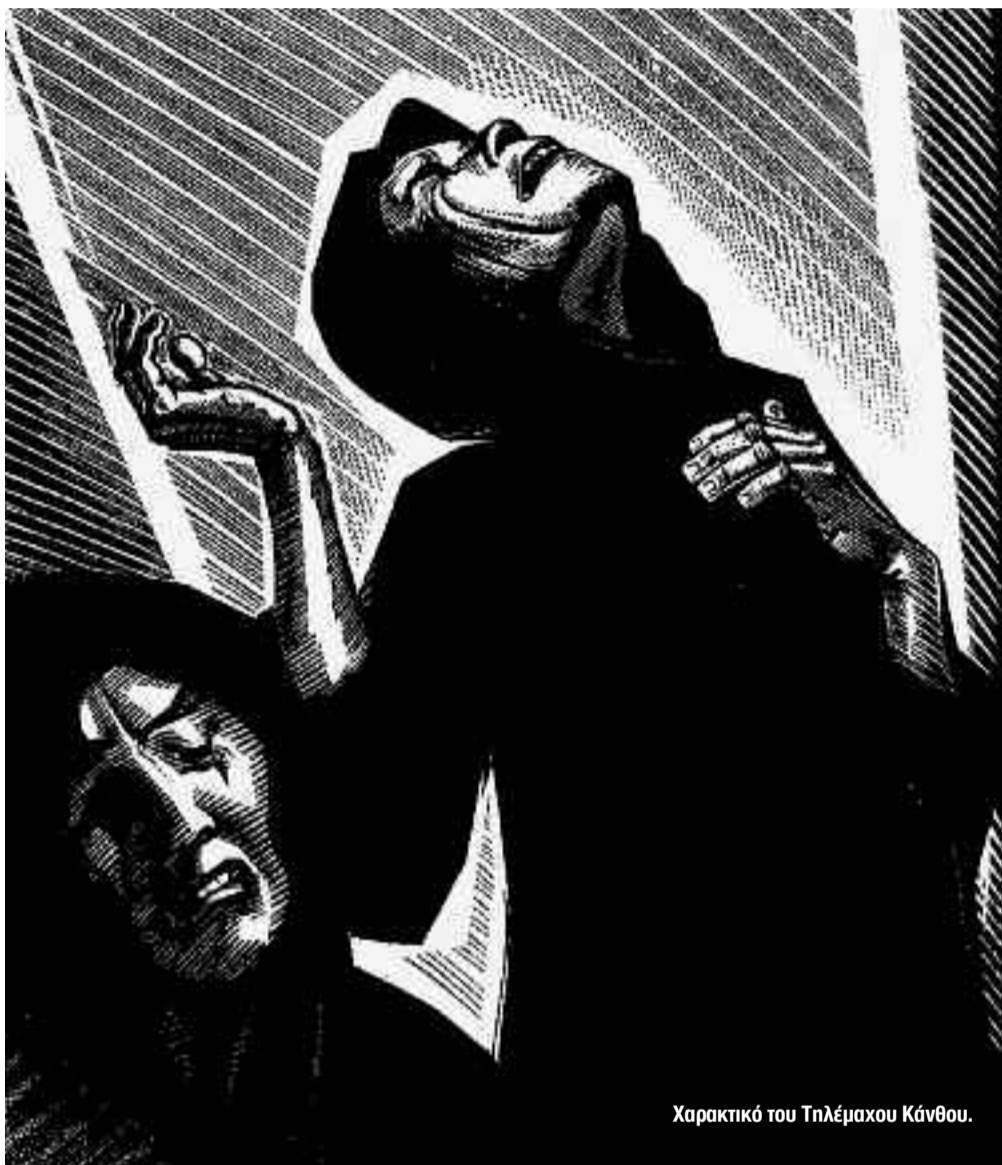
Χαρακτικό του Τηλέμαχου Κάνθου.

Αφιέρωση Στον πατέρα που έφυγε για τον άλλο τόπο