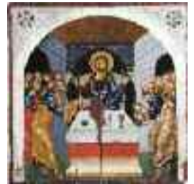
Κοινωνία των Αποστόλων τέλη 15ου αιώνα

Τα τουρκικά στρατεύματα προέβησαν σε μια άνευ προηγουμένου εθνοκάθαρση με τον εκτοπισμό του ελληνικού πληθυσμού από τις πατρογονικές του εστίες, τον εποίκισμό με πληθυσμούς από τα βόρεια της Ανατολής ή της Μαύρης Θάλασσας και την παράνομη αλλαγή των αρχέγονων τοπωνυμίων της Κύπρου με καινοφανή τουρκικά, οι εκκλησίες, το μόνο σημάδι χριστιανικής παρουσίας που απέμεινε ορατό στο βόρειο τμήμα του νησιού, επιδιώκεται να εξαλειφθούν. Η Εκκλησία της Κύπρου και η παγκόσμια ακαδημαϊκή κοινότητα παρακολουθεί με αγωνία την πρωτοφανή αυτή καταστροφή της πολιτιστικής κληρονομιάς και απευθύνει έκκληση να επιτραπεί από τις κατοχικές αρχές και κυρίως από την Τουρκία η δυνατότητα επιδιόρθωσης, αναστήλωσης και ανακαίνισης όλων ανεξαιρέτως των αρχαιολογικών και θρησκευτικών μνημείων στην τουρκοκρατούμενη Κύπρο, καθώς επίσης και των κοιμητηρίων, να αποδοθούν τα ιερά σκεύη που κοσμούσαν τους ναούς στους νόμιμους ιδιοκτήτες τους και να ασκηθεί και πάλι το δικαίωμα της θρησκευτικής ελευθερίας στο τουρκοκρατούμενο τμήμα της Κύπρου.