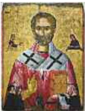
Άγιος Νικόλαος, 16ος αιώνας.

Μιλήστε μας σας παρακαλώ για τη συστηματική λεηλασία των εκκλησιών που βρίσκονται στην κατεχόμενη Κύπρο από τους τούρκους εισβολείς και τις προσπάθειες που γίνονται για τη διεθνή ανάδειξη του θέματος αυτού, όπως και τον επαναπατρισμό των πολιτιστικών θησαυρών που εκλάπησαν.